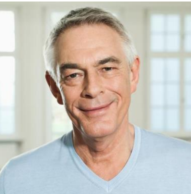
ENVEJECIMIENTO DE LA POBLACIÓN