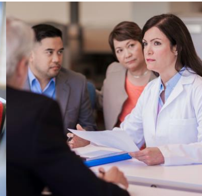
VOLUMEN SOBRE VALOR